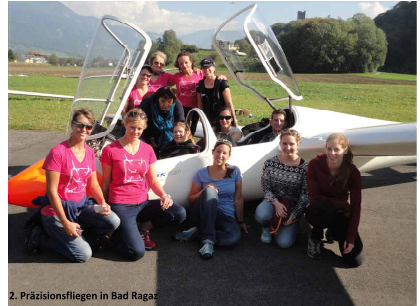
2. Präzisionsfliegen in Bad Ragaz

Anmeldung bis 10.1.2015 an: Ch. Bürki, Lindenstrasse 9, 5430 Wettingen, christine.buerki@bluewin.ch oder 079 540 91 23